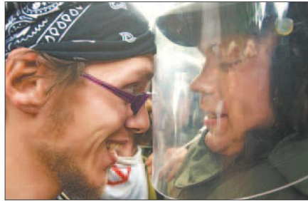
Les policiers étaient plus présents que les manifestants hier à Montebello.

Stephen Harper, au sujet des manifestants