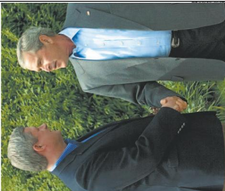
Le premier ministre Stephen Harper et le président américain George W. Bush, à l'arrivée de ce dernier à Ottawa hier.