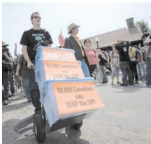
Les manifestants ont tenu à livrer leur message.

Mme Côté croit pour sa part que le bruit de la rue demeure efficace. « Avec la musique qu'il y a ici et le bruit que nous faisons, je crois qu'ils nous entendent. » (L-D.E)