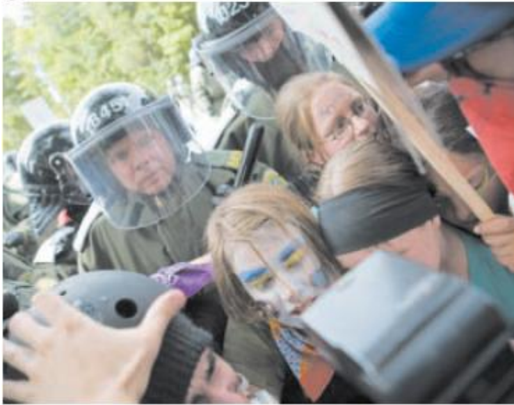
Les manifestants ont été repoussés par les forces de l'ordre qui étaient en grand nombre aux abords du Château Montebello.