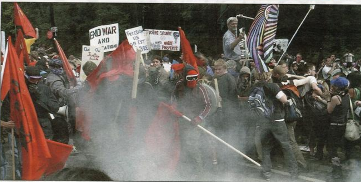
■ Une échauffourée a éclaté entre les forces de l'ordre et les manifestants les plus irréductibles. Les policiers ont utilisé du poivre de Cayenne et du gaz lacrymogène.