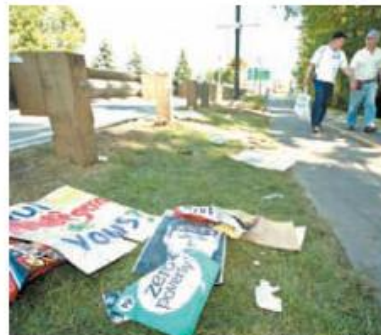
La visite des États-Unis et du Mexique est partie...pour les curieux et les manifestants, c'est le moment de retourner à la maison.

énergétiques. Le dernier vise une plus grande harmonisation de la réglementation des trois pays, sans pour autant mettre en péril la santé et la sécurité des consommateurs et sans sacrifier la souveraineté de chacun des États sur son territoire. Un comité sera mis sur pied afin de coordonner les travaux. Si l'on en croit les documents d'information remis aux médias, le groupe dont la composition n'a pas été rendue publique aura en outre pour mandat de « faire rapport aux dirigeants, aux ministres et à la population » sur les progrès réalisés. Cette mesure est de nature à calmer un peu les critiques qui reprochent aux gouvernements du Canada, des États-Unis et du Mexique de taire leurs véritables intentions et de s'abriter derrière le Partenariat sur la sécurité et la prospérité mis sur pied en 2005 pour préparer une union économique des Amériques semblable à l'Union européenne (UE).