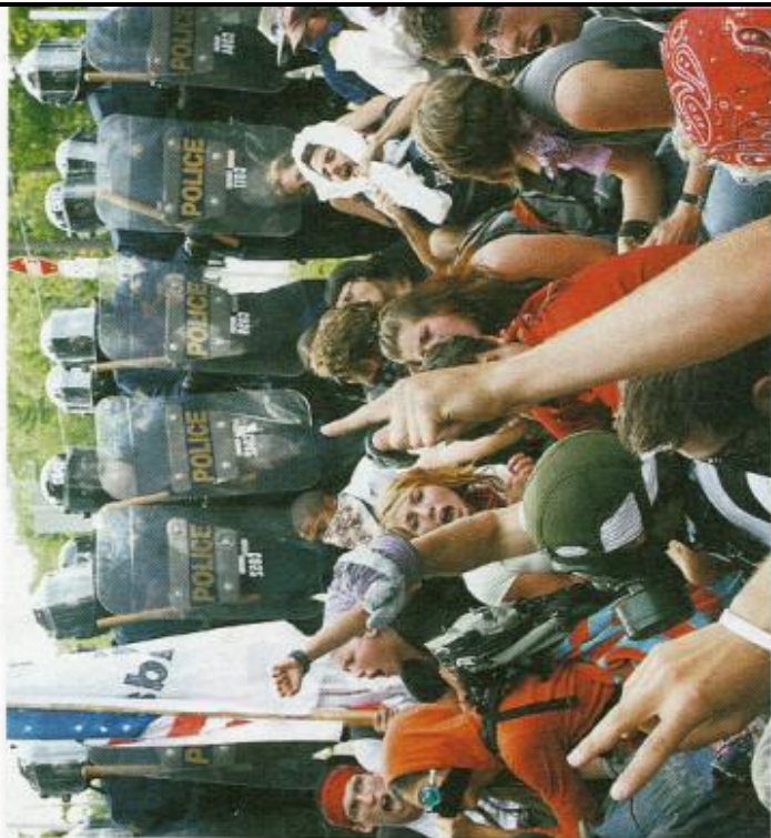
Les opposants au Partenariat nord-américain sur la sécurité et la prospérité réunie des groupes aux positions diamétralement opposées. Plusieurs craignent que ce partenariat n'entrave les libertés civiles.

Ses collègues et elle en ont contre ce qu'ils décrivent comme une conspi-ration des « laquais du nouvel ordre mondial » en vue de renverser les États-Unis (le Canada et le Mexique)