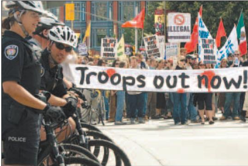
Environ 2 000 personnes ont montré leur désaccord hier, à Ottawa, quant au sommet.

Le PSP a aussi été dénoncé par la droite américaine qui estime qu'il constitue une menace à la souveraineté des États-Unis.