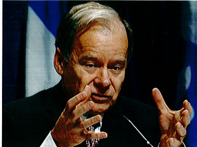
Raymond Bachand, ministre des finances

C'est ce même budget qui annonce les nouvelles hausses de frais de scolarités. La ministre de l'éducation parle maintenant d'une hausse de plus de 3000$ ce qui porterait les frais de scolarité à l'université à plus de 5300$ par année. Citoyens et citoyennes de la province, refusons de laisser ceux et celles qui nous dirigent saper les programmes sociaux acquis de longue haleine, au profit des grandes entreprises! Il n'y a qu'à considérer l'argent qui chaque année s'échappe vers des paradis fiscaux pour voir que le sous-financement des services publics, de l'éducation et de la santé n'est qu'une décision idéologique et non une fatalité.