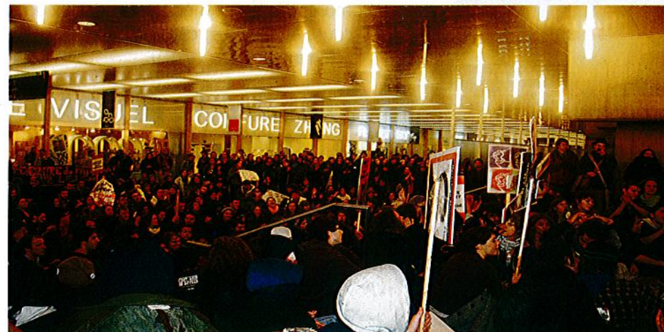
La manifestation est entrée dans le Palais des congrès de Montréal

Atteindre la moyenne canadienne des frais de scolarité (5350$) sur une période de 4 ans