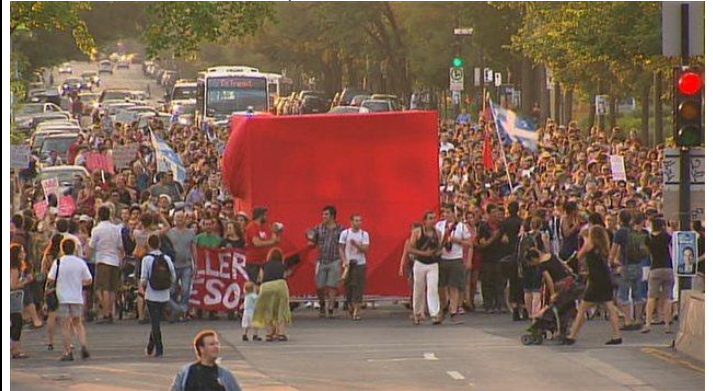
Manifestation de casseroles dans Villeray

La manifestation avait été marquée par des gestes de violence, faisant expulser la CLASSE de la table de négociations. La suspension des pourparlers entre les étudiants et le gouvernement du Québec a été décrétée le lendemain, jour marqué par de nouveaux affrontements entre policiers et manifestants dans la métropole.