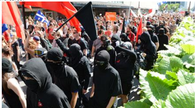
(Sébastien Saint-Jean, Agence QMI)

(CLASSE) et la Coalition opposée à la privatisation et à la tarification, elle est la première de la série à se tenir pendant la campagne électorale. La manifestation d'environ 5000 de personnes réunit notamment des étudiants, des membres de groupes communautaires et d'organisations syndicales.