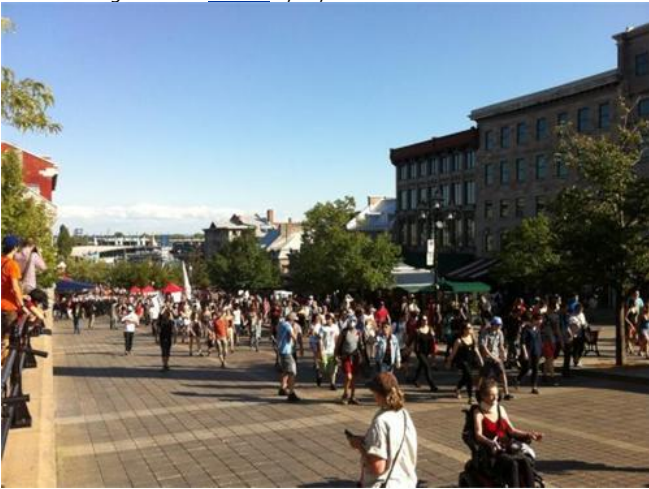
#manifencours Place-Jacques-Cartier#Qc2012 #22aout #22août #ggi t.co par blogocram via twitter 8/22/2012 8:36:21 PM