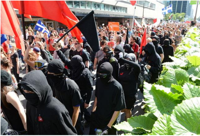
Des milliers de manifestants étudiants ont pris d'assaut le centre-ville de Montréal, pour protester contre la hausse des frais de scolarité. 22 août manifestation nationale