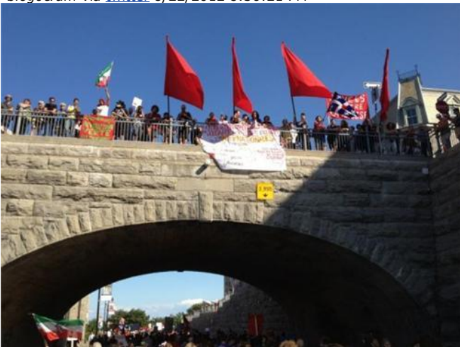
Entré du tunnel vers le vieux-Montréal #manifencours t.co par DomZero8 via twitter 8/22/2012 8:38:09 PM Des touristes mexicains qui empruntent des pancartes de manif pour prendre une photo-souvenir. LOL #22août #manifencours #ggi par MD_Duss via twitter 8/22/2012 8:43:56 PM