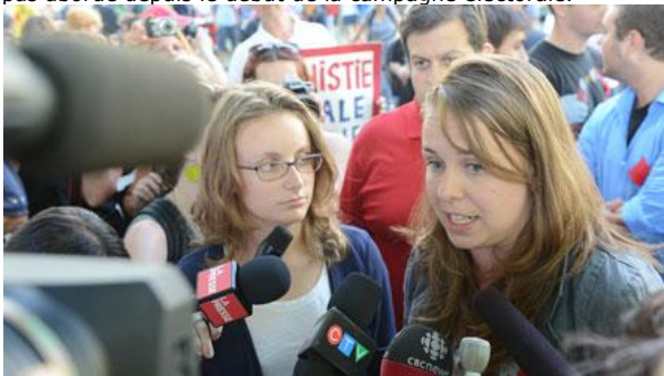
(Sébastien Saint-Jean, Agence QMI)

Mme Reynolds a renchéri en disant que le problème des iniquités sociales n'est pas abordé depuis le début de la campagne électorale.