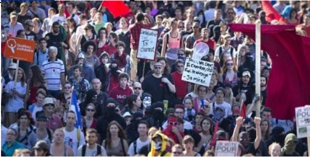
La manifestation du 22 du mois s'est déroulée sur fond de campagne électorale, à l'initiative d'une coalition d'organisations communautaires, étudiantes, syndicales, féministes et écologistes.