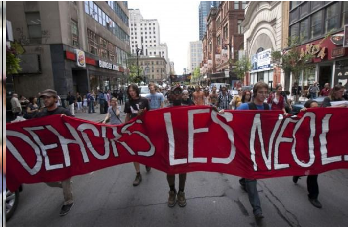
Le photographe de Métro Yves Provencher a suivi la manifestation qui s'est déroulée mercredi midi au centre-ville de Montréal. Quelques 200 manifestants associés à la CLASSE sont partis du Square-Phillips pour se rendre devant l'édifice d'Hydro-Québec sur le boulevard René-Lévesque, sans que leur itinéraire ne soit fourni à l'avance aux policiers. Le Service de police de la Ville de Montréal (SPVM) a déclaré la manifestation illégale aux alentours de 13h.