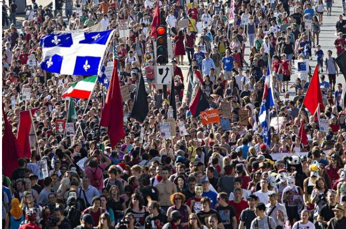
Des milliers de personnes se sont rassemblées le 22 août dernier pour manifester contre la hausse des droits de scolarité.