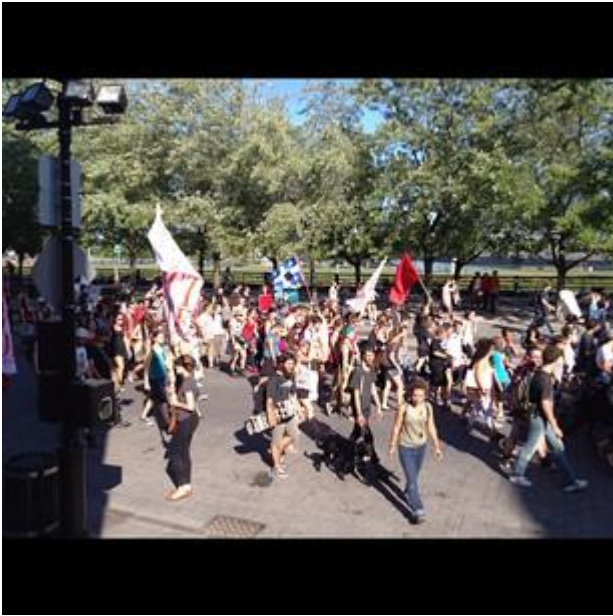
#manifencours #manif #vieux-Montréal #protest #oldmontreal #debatq #dehorscharest @ Marché Bonsecours t.co par Luciadominguez0 via twitter 8/22/2012 8:36:11 PM