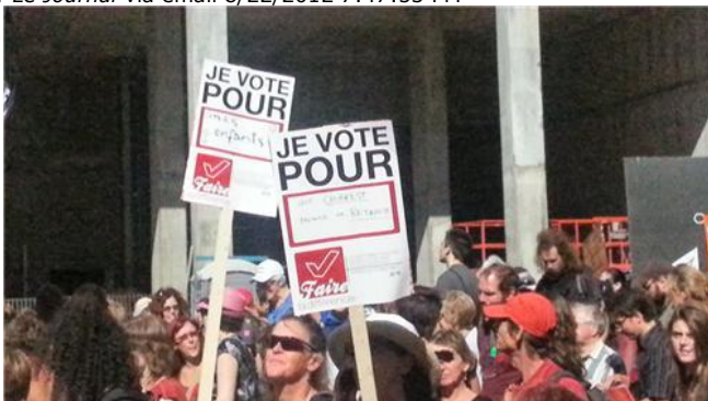
Coin University et Sainte-Catherine par Le Journal via email 8/22/2012 7:47:53 PM

À partir de St-Laurent, la #manifencours tourne sur Ste-Catherine en direction est. #GGi #22aout #manif22 par SPVM via twitter 8/22/2012 7:53:27 PM #manifencours #22aout #ggi on tourne ste cath par kuslak via twitter 8/22/2012 7:53:31 PM