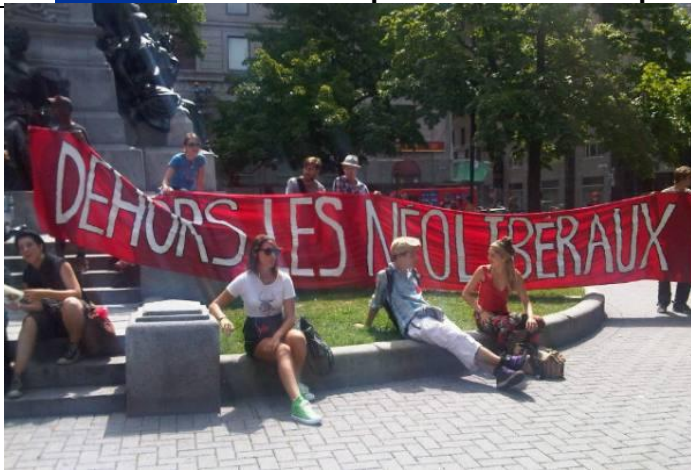
Protesters at Phillips Square in Montreal on Wednesday lounge in front of a banner whose message translates as: "Out with the neoliberals."