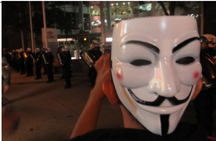
Méto 100e manifestation nocturne au premier jour de la campagne électorale