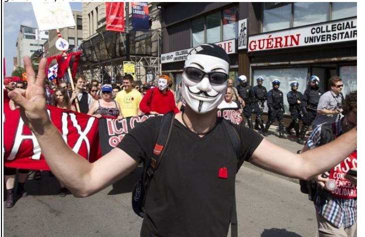
Des manifestants s'opposant à la hausse des droits de scolarité lors de la marche du 22 juillet dernier.