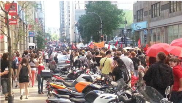
Coin University et Sainte-Catherine 8/22/2012 7:47:53 PM