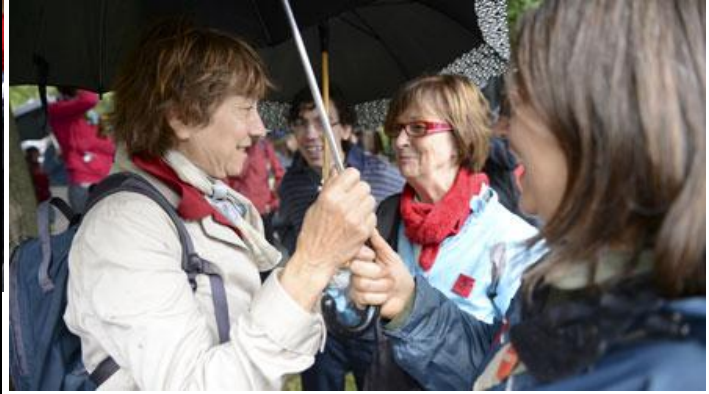
(Joël Lemay, Agence QMI)

Quelques instants plus tard, deux personnes ont été arrêtées pour attroupement illégal. Un constat d'infraction leur a finalement été remis pour avoir enfreint un règlement municipal.