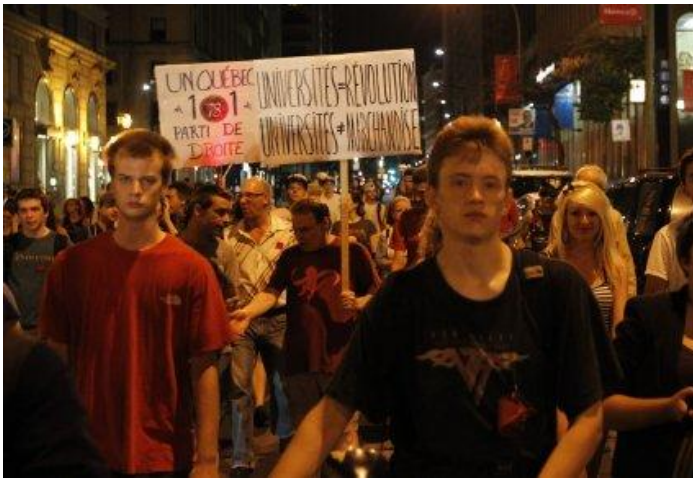
Malgré un taux de participation plus faible que la veille, les manifestants ne semblaient pas préoccupés.