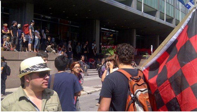
Quelques centaines de personnes ont répondu à l'appel de la Coalition large de l'association pour une solidarité syndicale étudiante (CLASSE) et

se sont réunies pour bloquer l'entrée du siège social d'Hydro-Québec à Montréal, mercredi midi.