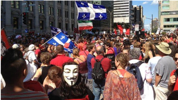
Manifestation à Montréal