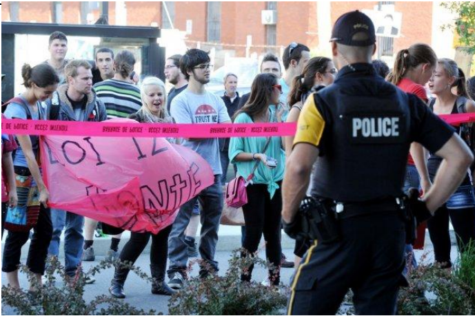
David Bombardier, La Tribune