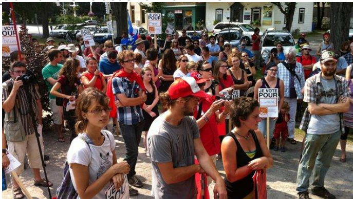
Les étudiants se sont regroupés au parc de la Gare.

Environ 150 étudiants ont manifesté contre la hausse des droits de scolarité au centre-ville de Rimouski.