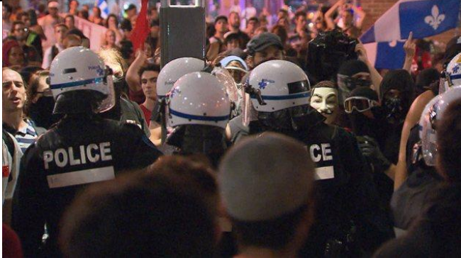
Manifestants et policiers du SPVM lors de la 100e manifestation nocturne Le reportage de Benoît Giasson

Au premier jour de la campagne électorale au Québec, des milliers de personnes sont descendues dans les rues de Montréal mercredi soir pour participer à la 100e manifestation nocturne consécutive contre la hausse des droits de scolarité et la loi 78.