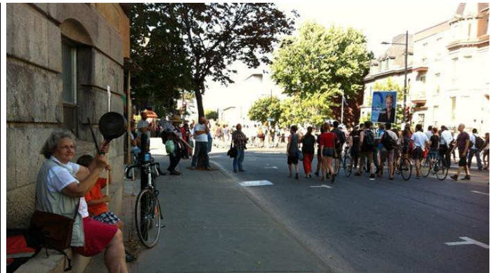
Apparition des casseroles sur le chemin des manifestants