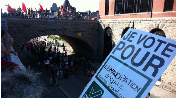
Les manifestants sillonnent plusieurs artères de Montréal.