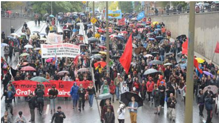
(Joël Lemay, Agence QMI)