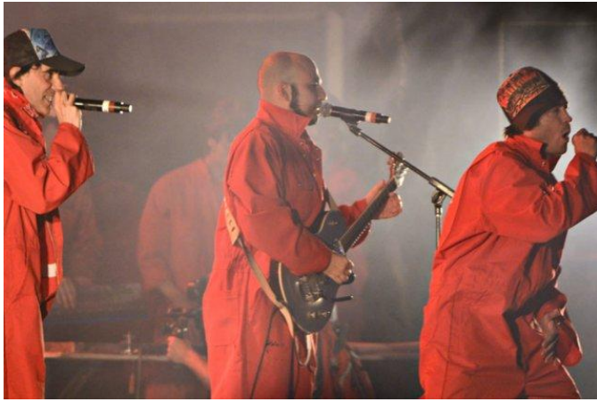
Le groupe Loco Locass, lors de son spectacle extérieur aux FrancoFolies de Montréal, en juin dernier.