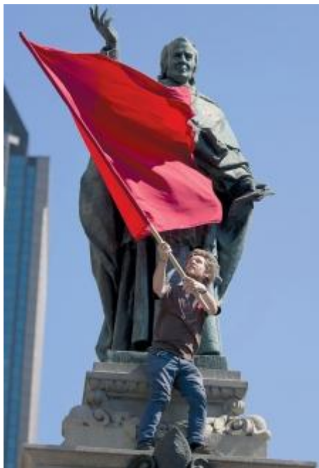
Des milliers de manifestants ont marché dans les rues de Montréal, mercredi.