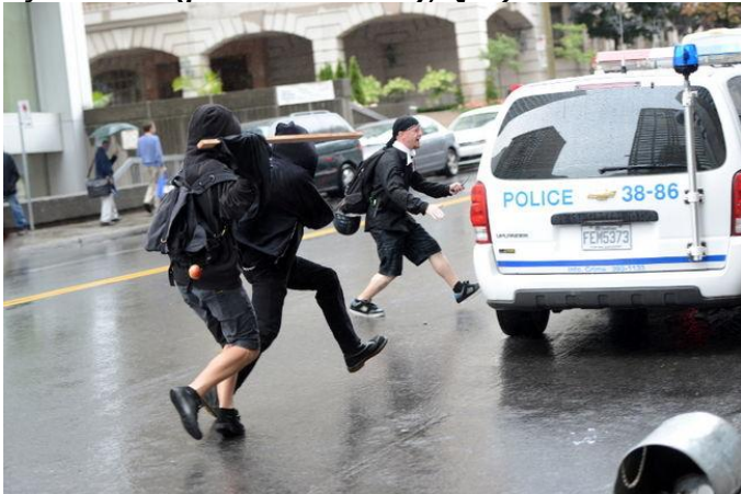
Des manifestants s'en sont pris à une voiture de police garée, entre autres à l'aide d'un bâton pendant la manifestation.