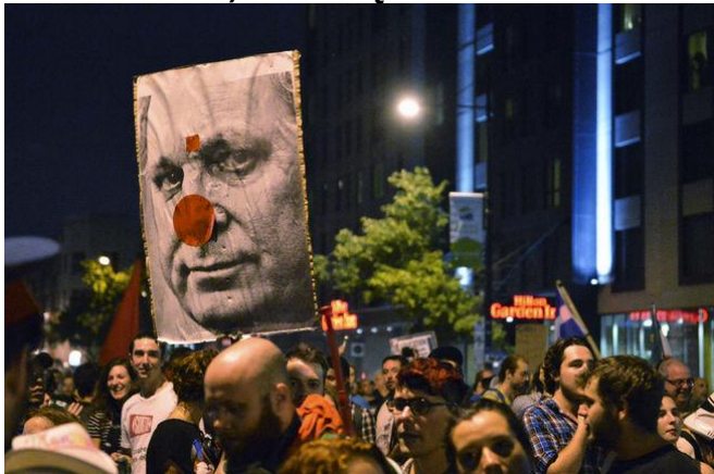
Alors que la campagne électorale avait été déclenchée dans la même journée, des milliers de manifestants se sont rassemblés afin de protester contre la hausse des frais de scolarité et la loi 78, dans le cadre de la 100e manifestation nocturne, à Montréal, le mercredi 1er août 2012.