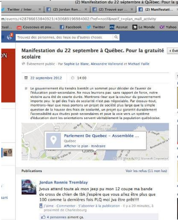
Capture d'écran Des menaces sur facebook

Un virulent opposant aux mobilisations étudiantes a posté un message particulièrement menaçant, sur Facebook, visant la manifestation de Québec du 22 septembre. Il fera vraisemblablement face à des accusations criminelles.