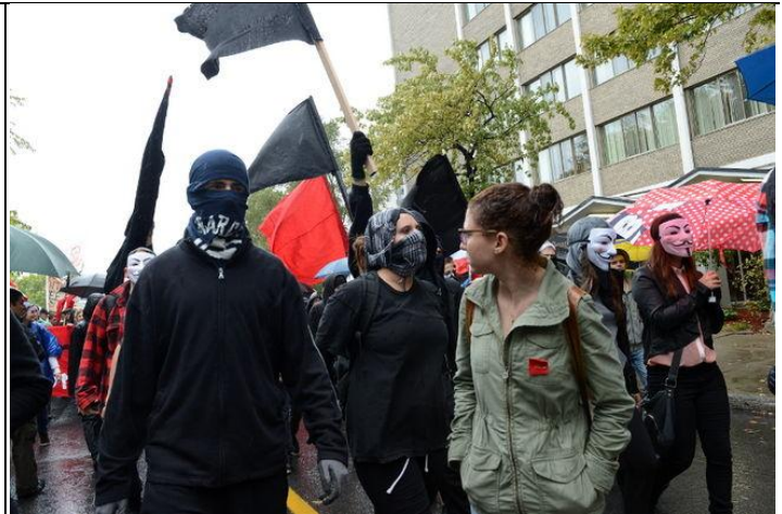
De nombreux manifestants portaient masques, foulards ou cagoules pour cacher leur identité.