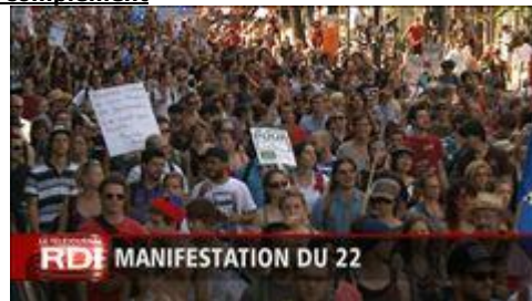
Vidéo - Le compte rendu de Jacques Bissonnet Les commentaires (367)