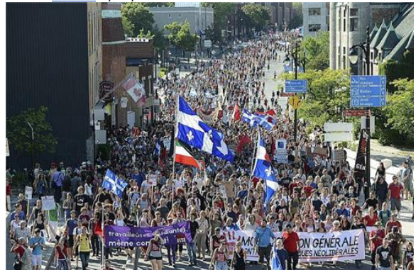
La manifestation un peu plus tôt cet après-midi. par Mathieu Turbide , directeur...8/22/2012 9:05:29 PM