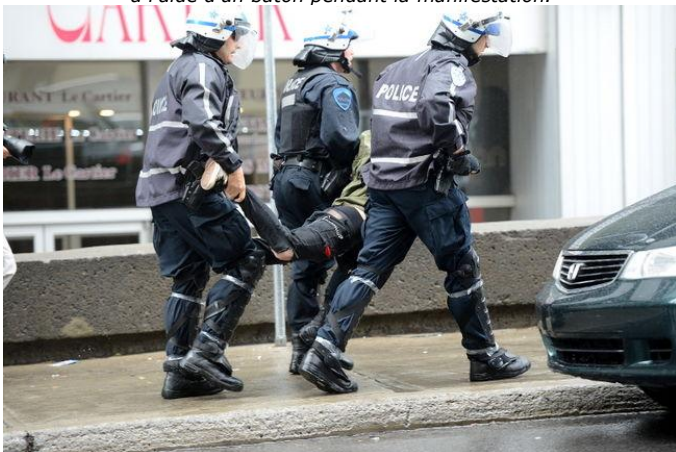
Les policiers du Service de police de la Ville de Montréal ont procédé à deux arrestations pour attroupement illégal en vertu d'un règlement municipal.