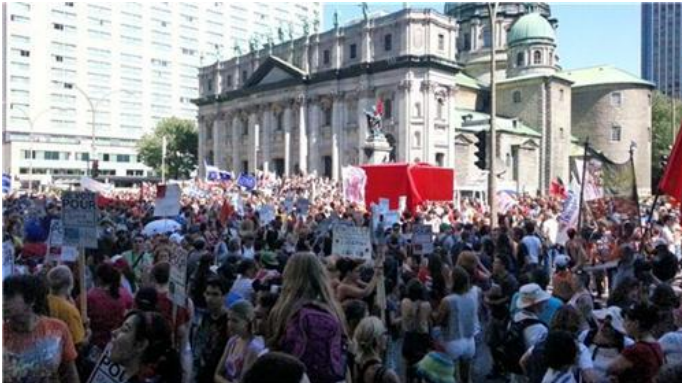
Plusieurs dizaines de milliers d'étudiants manifestent en ce moment dans les rues de Montréal. par Le Journal Modifié par Mathieu Turbide, directeur... 8/22/2012 6:33:51 PM