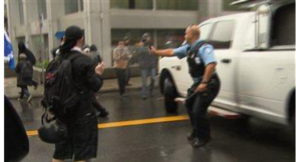
Manifestation du 22 septembre, au centre-ville de Montréal

@leoblouin Que penses-tu de l'intervention policière à la #manifencours du #22septembre ? #qqi #polqc #assnat